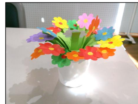
色とりどりの花が入った花かごのできあがり。きれいにできて、みんなニコニコ笑顔です。