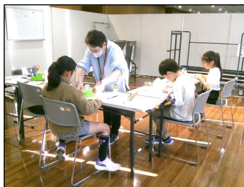
お花が開いたように、外側に茎を広げます。