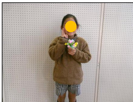
茎になるところをふわふわ広げるのが楽しかったよ。