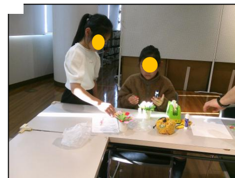
お喋りしながら作るのも楽しいね。