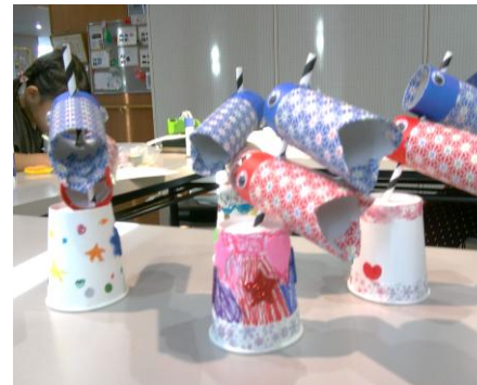
みんな、すてきな作品を作り あげました。