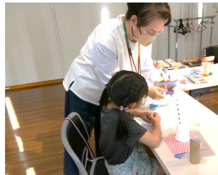
少しだけ手を添えてお手伝い。