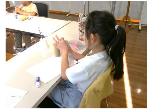
もくもくと黙って静かに作っています。