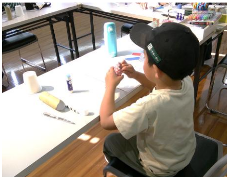
もうすぐ出来上がり。