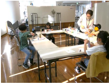
今年度初めての「作ってあそぼう」 少し緊張気味の子どもたち。