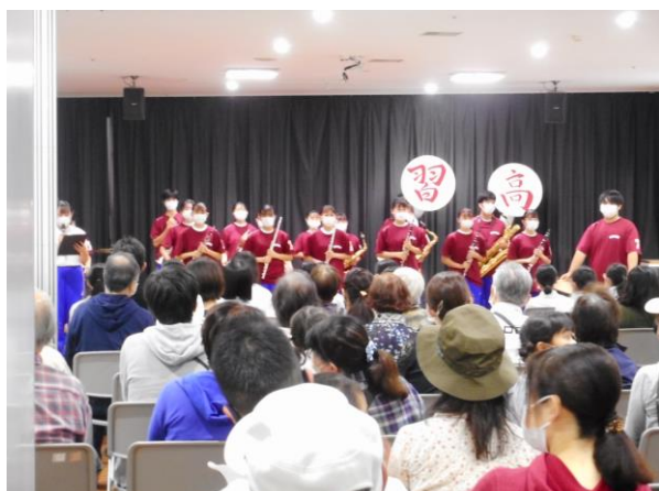
習志野市立習志野高等学校吹奏楽部