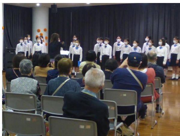
習志野市立大久保東小学校合唱部