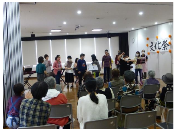
むつみおもちゃ図書館(合奏など)