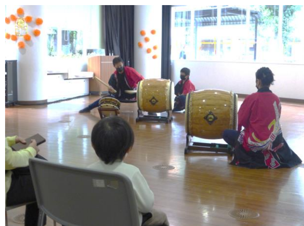
こどんさん(和太鼓演奏)