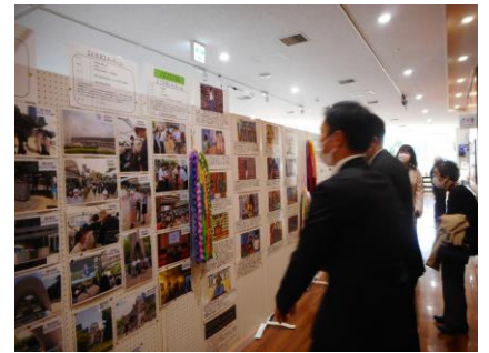
核兵器廃絶平和都市宣言記念展