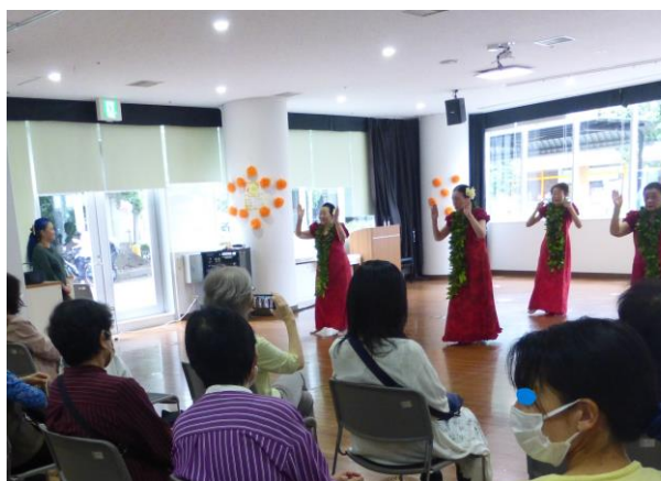
モアナラニ千寿会(フラダンス)