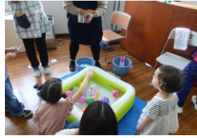
にぎやかな縁日コーナー