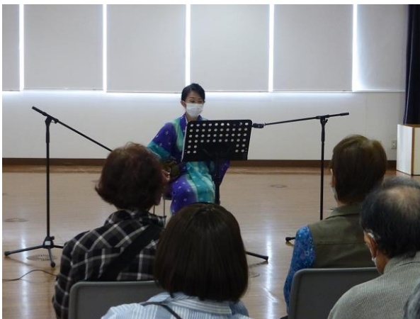
沖縄唄三線(三線と琉球民謡)