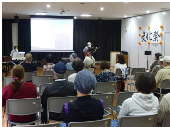
歌声喫茶 & ToPaZ (伴奏と歌)